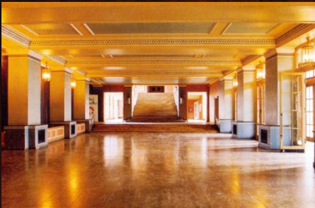
Kulturpalast Unterwellenborn (TH), 1955, oben Kulturhaus Mestlin (MV), 1957, mitte Kulturpalast Bitterfeld (ST), 1954, unten