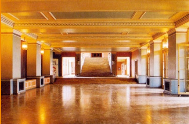
Kulturpalast Unterwellenborn (TH), 1955, oben Kulturhaus Mestlin (MV), 1957, mitte Kulturpalast Bitterfeld (ST), 1954, unten